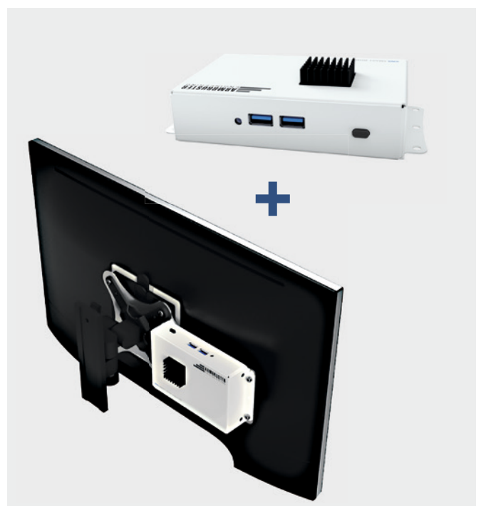
Ein Monitor und der SWA-Mini Client bilden die ELAM DOKUMENTENANZEIGE