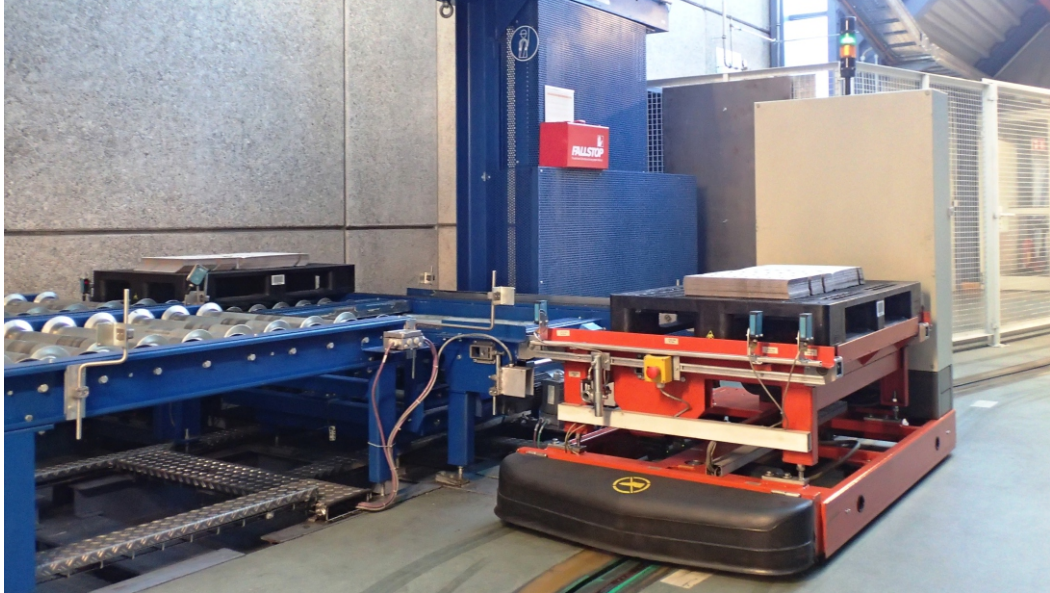
Jedes der 12 Flurförderfahrzeuge ist mit einer WERMA-Signalsäule und einem Funksender ausgestattet. Kommt es zu einer Störung, wird diese quasi in Echtzeit auf einen zentralen PC und die Mobiltelefone übertragen.

Ende 2014 installierte Continental Regensburg auf allen 12 Flurförderfahrzeugen, welche für den Materialtransport zwischen Logistik und Fertigung verantwortlich sind, eine WERMA-Signalsäule in den Farben grün und gelb sowie einem Funksender. Das System von WERMA basiert auf einem „Wireless Information Network“ und funktioniert als kostengünstiges, funkbasiertes MDE-System (Maschinen-Daten-Erfassungs-System) zur Optimierung von Logistik, Fertigung und Montage.