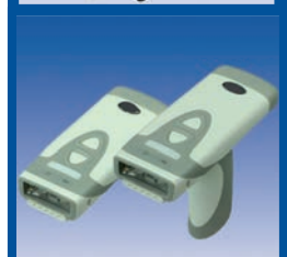
RFID, Lesegeräte & Datenerfassung