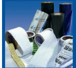
Etiketten & Farbbänder